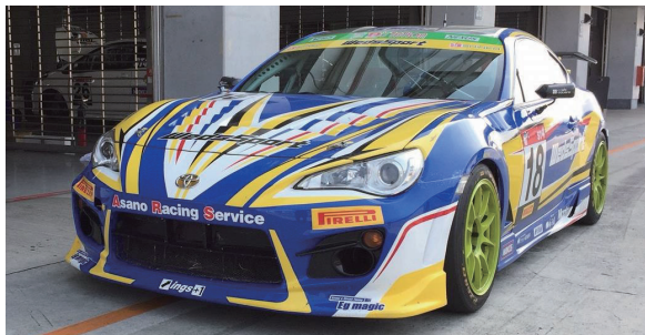
18 PIRELLI SUPER TAIKYU SERIES 2018, ST4 CLASS WedsSport 86

チーム監督は浅野真吾監督。ドライバーには長年日本のモータースポーツで活躍しているレジェンド・浅野武夫選手、そして昨年に引き続き期待のヤングドライバー・井上雅貴選手を迎え、磐石の体制でシリーズチャンピオン獲得を目指します。